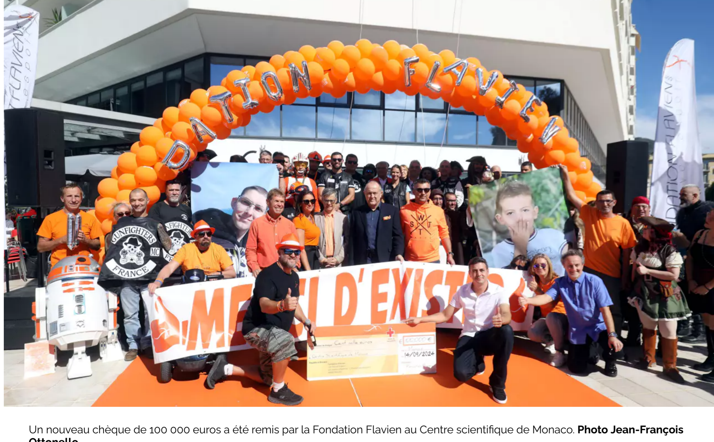
Un nouveau chèque de 100 000 euros a été remis par la Fondation Flavien au Centre scientifique de Monaco.

Article réservé aux abonnés Thibaut Parat • Publié le 15/09/2024 à 09:45, mis à jour le 15/09/2024 à 10:08