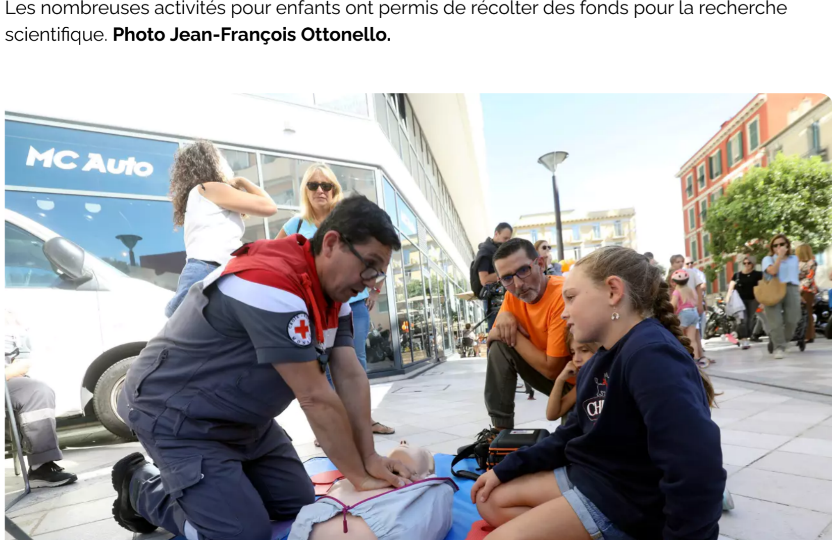
La Croix-Rouge monégasque tenait un stand de sensibilisations aux gestes de premiers secours.