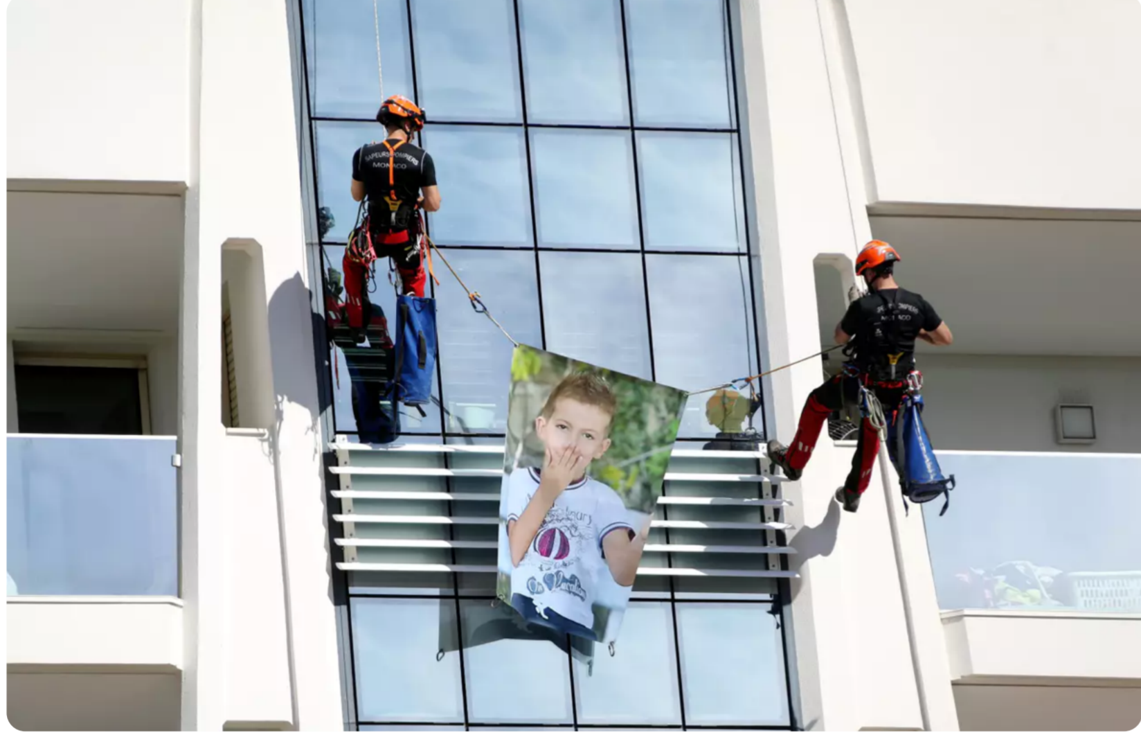
Ce sont les sapeurs-pompiers monégasques du Groupe d'intervention sauvetage périlleux qui, depuis le toit des Jardins d'Apolline, ont descendu les deux portraits de deux garçons victimes de cancers pédiatriques.

"Je milite pour que ce produit arrive en premier recours, pas en dernier.." , soutient, quant à lui, Denis Maccario. L'essai clinique doit durer trois ans.