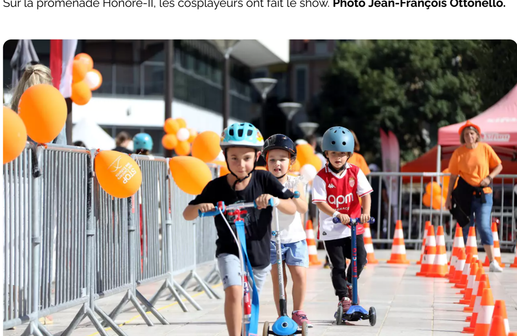
Les nombreuses activités pour enfants ont permis de récolter des fonds pour la recherche scientifique.